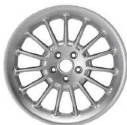
19" Multispoke Alloy Wheels - Silver