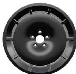
19" Forged Aerolite Alloy Wheels - Anthracite