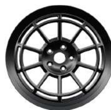
18" Superlite Alloy Wheels - Black