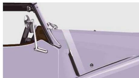
Bonnet Stripe - Matte Clear