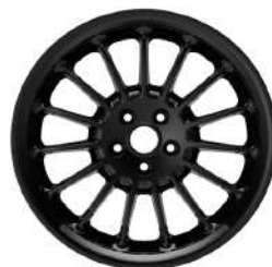
19" Multispoke Alloy Wheels - Black