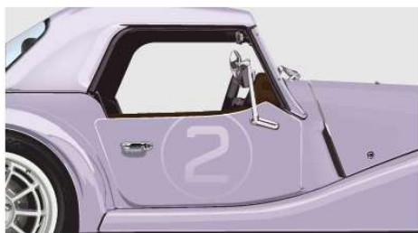
Door Roundels - Matte Clear with Number