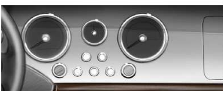
Dashboard - Matte Silver Painted