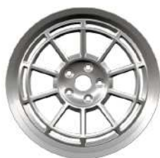
18" Superlite Alloy Wheels - Silver