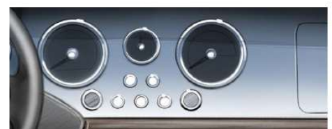
Dashboard - Gloss / Matte Body Colour Painted