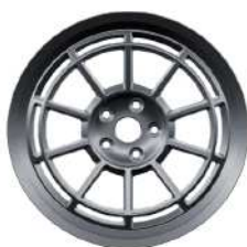
18" Superlite Alloy Wheels - Frozen Grey