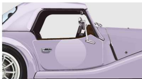
Door Roundels - Matte Clear