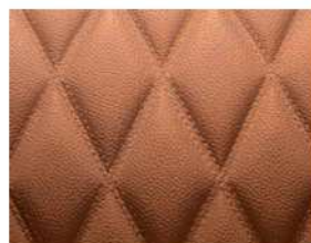
Quilted Twin Needle Stitch