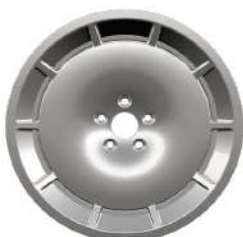
19" Forged Aerolite Alloy Wheels - Silver