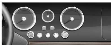
Dashboard - Gloss Black Painted