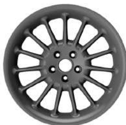
19" Multispoke Alloy Wheels - Frozen Grey