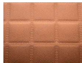
Square Box Stitch